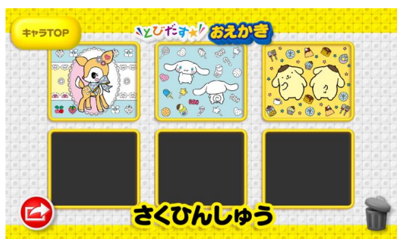
©1996, 2001, 2014, 2017 SANRIO CO., LTD. TOKYO,