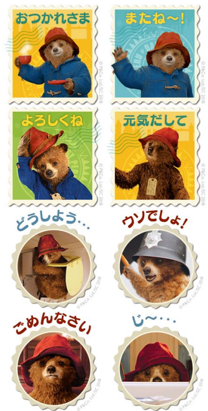
<スマートフォン用壁紙イメージ>