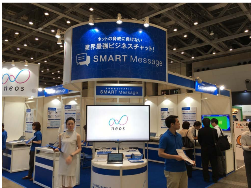
■ワークスタイル変革 EXPO 出展時の様子

1つは業務の連絡効率・スピード・品質を向上させる次世代ビジネスチャットサービス【SMART Message】ラインアップ。もう1つはオンラインサービスの性能を“見える化”する、世界で唯一の監視・計測ソリューション【ARGOS(アルゴス)】を展示いたします。ワークスタイルの刷新と、生産性向上の実例を、デモを通してご紹介いたします。ぜひ当社のブース8-16(5ホール出入口/通路8・9付近)にお立ち寄りください。