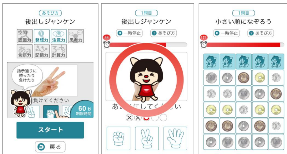
<脳トレドリル画面イメージ>

毎日更新される脳トレドリルで脳の活性化を促します。高得点を目指し、「速く」「正確に」問題を解くよう意識することで脳を鍛え、ゲーム感覚で楽しみながら認知症を予防できます。さらに脳トレの成績と、効果的に脳を鍛える7つの能力(後述)毎に算出した点数をレーダーチャートで表示し、自身の苦手な分野を把握することで今後のトレーニングに役立てることが出来ます。