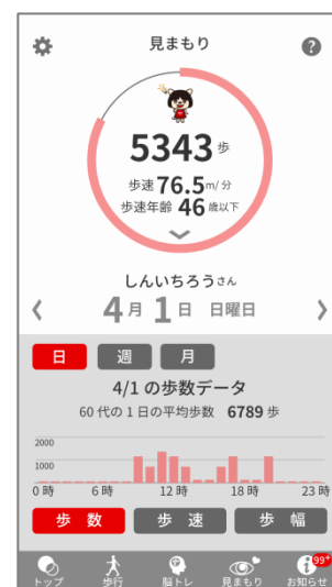
<見まもり家族画面イメージ>