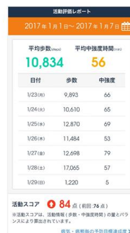
<活動評価レポート>

他にも「お知らせ PUSH 通知」や「開催後のアンケート調査」、「インセンティブ配布」など、参加率を向上させるとともにより効果的なイベント開催をサポートする充実した機能をご用意しています。