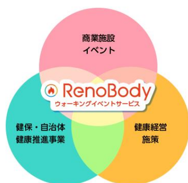
■イベントサービス活用例