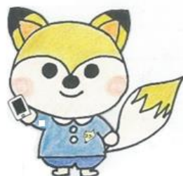
AI保育コンシェルジュ 「コンちゃん」

ネオスは今後もチャットボットサービスの提供を通じて、より便利で豊かな社会の実現に向けたDXを推進してまいります。