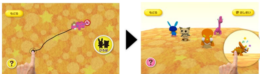
自分が塗ったキャラクターを自由に動かせる！