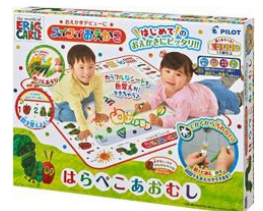
【ABCであそぼ はらぺこあおむしと 学びの時間】A賞 スイスイおえかき