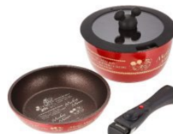
【ディズニーマジックペン】A賞 取っ手がとれる鍋&フライパンセット ディズニー ミッキーマウス ANFP2