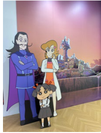
フオトスポット(炭の町)