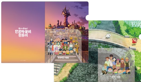
A4 クリアファイル(炭の町/秋田)