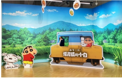
フオトスポット(炭坑電車)