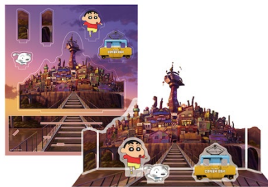
アクリルジオラマスタンド