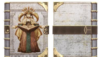
④ ブックカバー 「カルドラ(日本限定)」