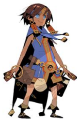
② 松浦聖氏描き起こし 「ナジャラン」