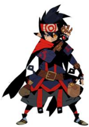
① 松浦聖氏描き起こし 「ゼネス」