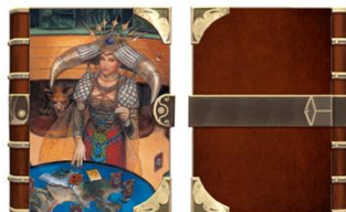
③ ブックカバー 「カルドラ(1st)」